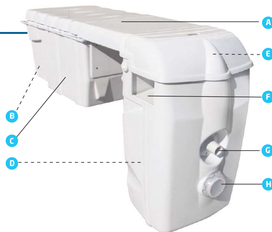
Schéma de principe